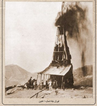
دوران چاه شماره ۱ فنون

در ایران البتات شده و صنعت نفت ایران فعالیت خود را آغاز کرد. چاه شماره ۱ در منطقه فنون (دره خرسان) مسجدسلیمان در استان خوزستان، اولین چاه نفت در خاورمیانه بود. حفاری این چاه زیر نظر رنولدز در سال ۱۲۸۶ خورشیدی شروع شده بود. از این چاه ۳۶۰ متری روزانه ۳۶ هزار لیتر (۸ هزار گالن) نفت به دست می آمد. سوخت ماشین های استخراج نفت با سوزاندن زغال، چوب درخت و نفت های سطح الارضی زیر دیمک های آب تأمین می شد. از سال ۱۲۸۷ تا ۱۳۳۴ خ حدود ۲۰۰ چاه نفت دیگر در مسجدسلیمان حفر و بیش از ۱۰۰ میلیون تن نفت از آنها استخراج شد. چاه شماره ۱ اکنون در مرکز شهر مسجدسلیمان به صورت موزه نگهداری می شود.